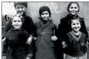
JEDNA ze dvou dochovaných fotografií ukryvaných židovských dětí.